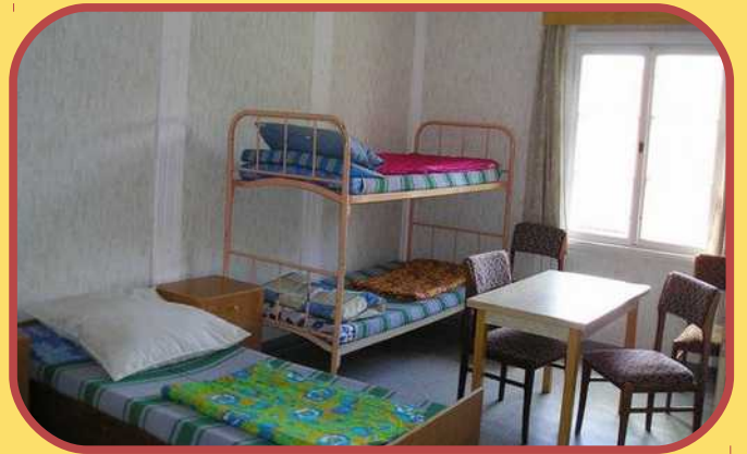
Mehrbettzimmer im Zebra