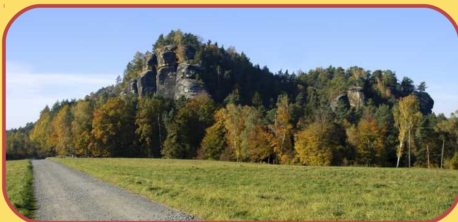
Der Rauenstein vor der Haustür