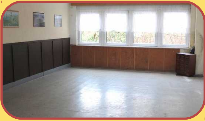
Großer Raum im Haupthaus