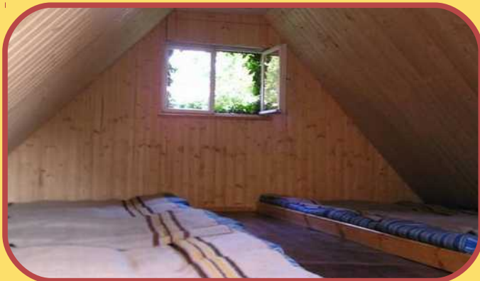
Schlafplätze unterm Dach vom Luchs