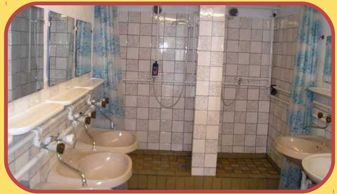
Duschen und Waschbecken im Zebra